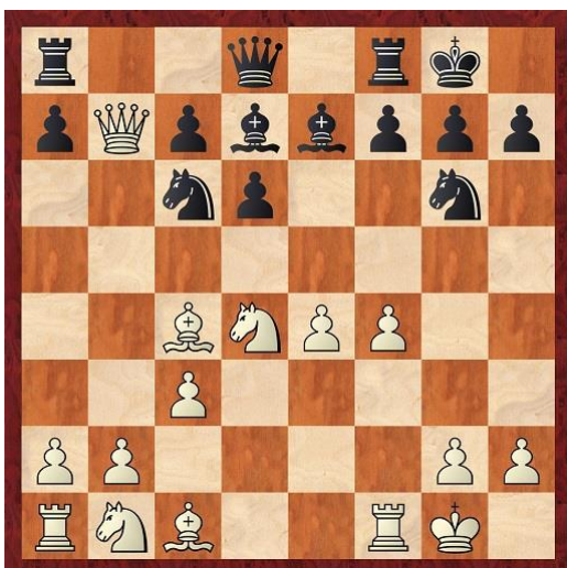
Stelling na 10.Db3xb7