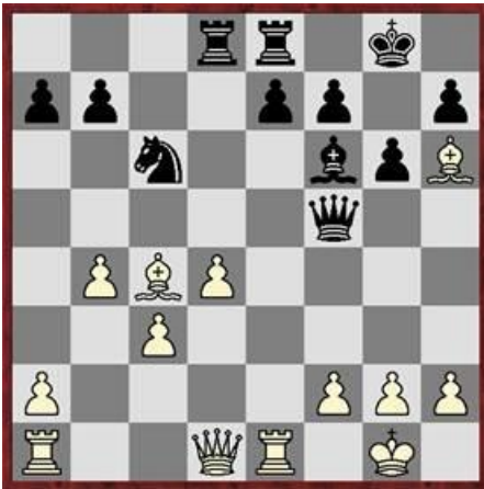
Stelling na 18.b2-b4?!

Toch nog een puntje van kritiek bij de analyse van mijn partij door Ton. Na 18.b4 beveelt hij Pxd4 aan, met het idee 19.cxd4 Lxd4 met dubbele aanval op f2 en Ta1 en bijna gelijke stelling.