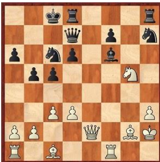
Stelling na 19... Pxd5

Siciliaans, Grand prix attack. 2... Pc6 3.Pf3 d6 4.c3 Lg4 5.g3 e5 6.d3 a6 7.Lg2 Pf6 8.Pa3 b5 9.Pc2 Le7 10.O-O h6 11.h3 Ld7 12.Kh2 Ph7 13.Pe3 exf4 14.gxf4 g5 15.Pf5 Lxf5 16.exf5 Dd7 Wit staat beter na 17.d4 17.De2 O-O-O 18.fxg5 hxg5 Zie diagram 2. Cor had op zijn blaadje als commentaar de zet 19.De4 opgeschreven maar na d5 blijft er weinig over van zijn aanval op het paard. 19.a4 of Kg1 zijn hier het best. 19.f6? Cor had minder dan een minuut. 19... Lxf6 20.Pxg5