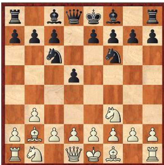
Stelling na 3... Pc6

1.b3 Deze opening is vernoemd naar Larsen, een indertijd sterke grootmeester. Zelf had hij er niet veel succes mee maar latere spelers als Magnus Carlsen en Richard Rapport wel. 1... d5 Ook e5 of Pf6 worden vaak gespeeld. 2.Lb2 Pf6 3.Pf3 Pc6