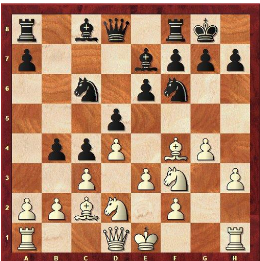
Stelling na 10...b5-b4