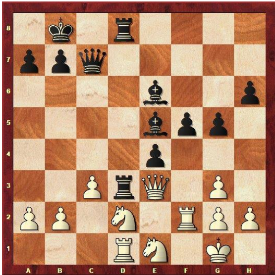
Stelling na 28...Td7-d3!?

Wit moet het offer wel aannemen, anders komt gewoon e3 en heeft hij niks. Achteraf had ik geen spijt van Td3, maar wel van Le5; want ik had liever Lf6-Le7 gespeeld, met Lc5 als doel. Nu ga ik de druk op d2 opvoeren, omdat Td1 niet (goed) gedekt is en het paard van d2 dus niet kan spelen.