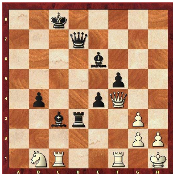
Stelling na 40...a5xb4