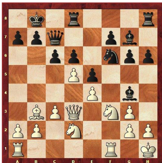
Stelling na 17.De2-d3