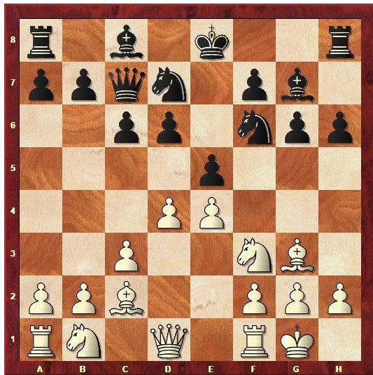
Stelling na 10.0-0