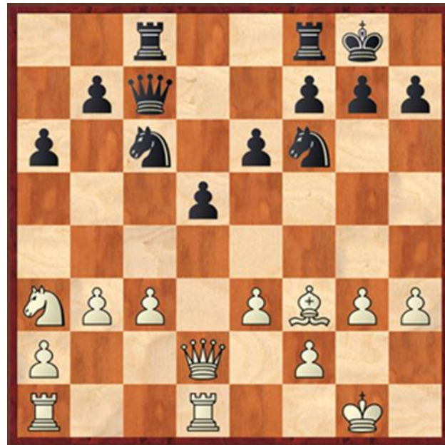
Stelling na 15... Pxa3

Zwart doet het hier in het algemeen goed met 3... cxd4. 3... Pc6 4.Lg2 Pf6 5.e3 Lg4 6.h3 Lxf3 7.Lxf3 e6 8.0-0 Tc8 9.c3 Ld6 10.b3 0-0 10... cxd4 11.exd4 0-0 En zwart staat prettig. 11.dxc5 Lxc5 12.Dd2 De engine van GM wil hier 12...e5 13.Td1 e4 14.Lg2 De7 spelen met -,5 als waardering. Mijn engine geeft de voorkeur aan 12...Pe4 om uiteindelijk een ondersteund paard naar d3 te krijgen en met een evaluatie van -1,3. 12...a6 13.Td1 Dc7? 13...Pe5 14.Lg2 Pe4 15.Lxe4? dxe4 is al ruim +2 voor zwart. 14.La3? 14 Lb2 is remise. Lxa3 15.Pxa3 Zie diagram 2. Ik had me al een paar zetten gefocust op 15... Da5 in deze situatie terwijl 15... Pe5 en daarna 16... Dxc3 gewoon een pion wint. 15...Da5 16.Pb1 b5 17.Db2 b4 18.cxb4 Pxb4 19.Td2?