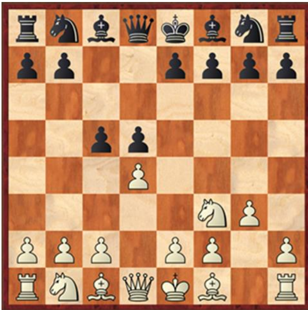
Stelling na 3.d4