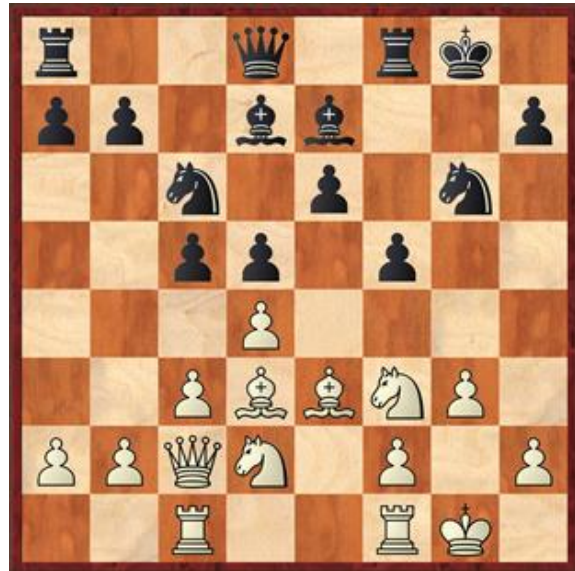
Stelling na 13... f5

De doorschuifvariant van de Karo Kahn. Als ik hier Pf3 gespeeld had, was ongetwijfeld Lg4 gevolgd. Zelf speel ik hier met zwart Lf5. 5... e6 na lang nadenken. 6.Pf3 Pge7 7.Ld3 Ld7 8.0-0 Pg6 9.Pbd2 Le7 10.Tc1 0-0 11.g3 Gespeeld met de gedachte om na rokade met h4 tot een koningsaanval te komen. 11... f6 12.exf6 gxf6 13.Dc2 f5 Zie diagram 2. 14.Lh6 geeft wit een klein voordeeltje. 14.dxc5? e5 15.Lh6 Tf7 16.Le2 e4 17.Pd4 f4