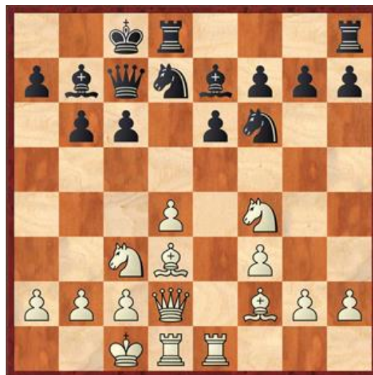
Stelling na 12... 0-0-0