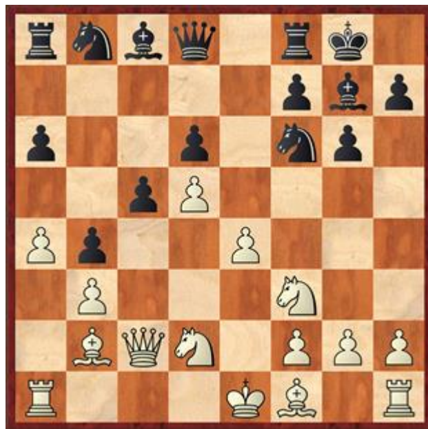
Stelling na 11... 0-0

Het Benko gambiet. Het meest gespeeld wordt hier 4... bxc 5.e4 4... e6 5.e4 exd5 6.cxd5 a6 7.a4 Het beste plan is nu 7... De7 8.Pe2 Dxe4 9.Dxe4+ Pxe4 10.axb5 Lb7 en +.64 voor wit. 7... b4? dit is een punt beter voor wit. 8.Pd2 d6 9.b3 g6 10.Lb2 Lg7 11.Pgf3 0-0 Zie diagram 2. De loper op f1 moet weg om te kunnen rokeren. 12.Lc4 12.Ld3 was veiliger geweest. 12... Te8 13.0-0 Een woeste computer variant is hier 13... Pxe4 14.Pxe4 Lxb2 15.Pxd6 Lxa1 16.Pxe8 Lc3 17.De4 Lf5 18.De3 Kf8 19.g4 Lxg4 20.Df4 en de stelling is in dynamisch evenwicht. 13... Pbd7 14.Pe1?