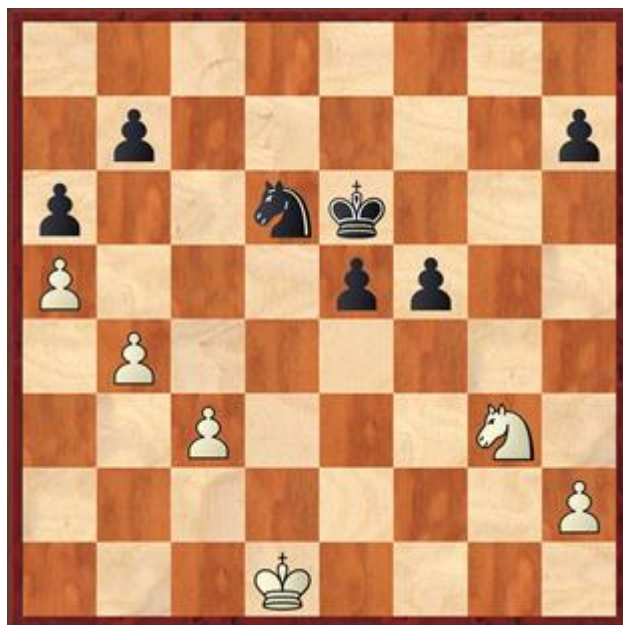
Stelling na 32... gxf5

18.b4 18.g3? Thd8 en wit komt niet meer los uit de verwurging. 18... Lb6 19.a4 Pxd2 20.a5 Le3+ 21.Kc2 a6 22.Pd2 Lxd2 23.Kxd2 Ke6 24.Thg1 Thd8+ 25.Kc1 Pe3 26.Ta2 26.Txd7? Td1+ 27.Kb2 Pc4+ kost een paard. 26... g6 27.Td2 Pc4 28.Txd8 Txd8 29.Td1 Txd1+ 30.Kxd1 Pd6 31.Pg3 f5 32.exf5+ gxf5 Zie diagram 4. Zwart staat maar 1 pion voor, maar de stelling is hopeloos voor wit. De meerderheid op de damevleugel kan nooit in beweging komen en de waardering is dan ook al -6. 33.Ke2 f4 34.Pf1 Pc4 35.h3 e4 36.Ph2 h5 37.Pf1 Kf5 38.Ph2 Kg5 39.Kf2 Kh4 40.Pf3+ exf3 41.Kxf3 Kg5 en Aat geloofde het verder wel, 0 - 1.