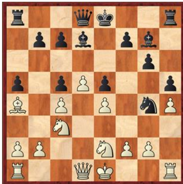
Stelling na 13... h5

Deze zet is geen theorie meer, maar stond wel bovenaan bij Stockfish. 7... Pa6 8.h4 Pc5 9.Lc2 h6 10.Le3 Ld7 11.Pge2 Pg4 12.Lxc5 dxc5 13.La4 h5 Zie diagram 2. 14.Th3? Wat is die toren van plan? 14.Lxd7+ Dxd7 15.Pg1 was nog prima speelbaar. 14... 0-0 Na 14... c6 was wit met zijn slechte loper blijven zitten. 15.Lxd7 Dxd7 16.Dd3 Lh6 17.Td1 Tae8 18.Tf3 Na 18.d6 c6 19.Pa4 heeft wit een klein plusje. 18... De7 19.Pb5? c6 20.dxc6 bxc6 21.Pd6 Td8