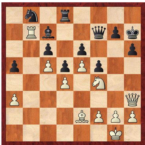
Eindstand (denk ik)