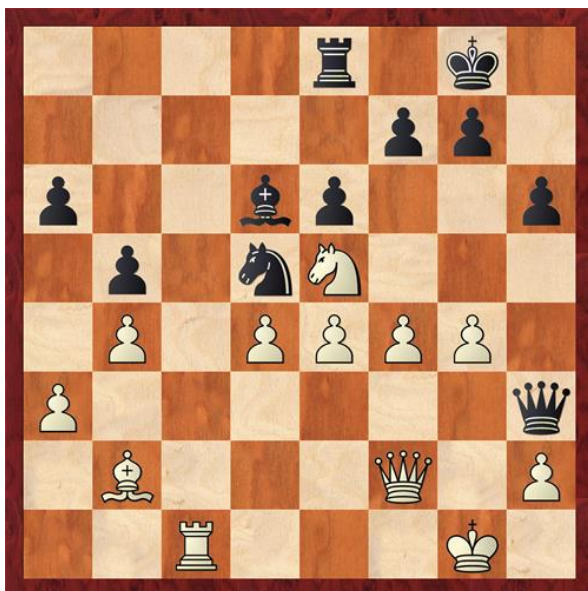
Stelling na 27...e4

Beiden hebben dezelfde slechte loper situatie. In dit soort symmetrische stellingen is het moeilijk voordeel te behalen. Alleen op de koningsvleugel is nog met goed fatsoen een doorbraak mogelijk. 12.Lb2 Tc8 13.Tac1 h6 14.De2 Te8 15.Pe5 Ld6 16.f4 Pe7 Zie diagram 2. 17.g4 is hier een goed idee. 17.Tc2 Lc6 18.Df3 Lb7 19.g4 Pe4 20.Pxe4 dxe4 21.Txc8 Dxc8 22.Lxe4 Lxe4 23.Dxe4 Pd5 24.Tc1 Dd8 25.Df3 Dh4? (Lxe5). Als wit nog wat wil dan is Pd3 en daarna Pc5 mogelijk maar de remise marge is nog groot. 26.Df2 Dh3 27.e4 (Zie diagram 3)