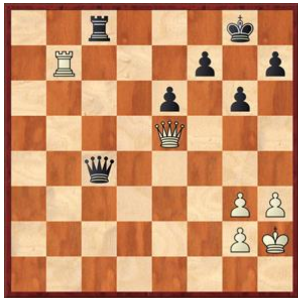
Slotstelling na 32.Txb7

20.Lxf4 was het enige. 20... Pxd3? Goed, maar er is beter. 20... Pd4! wint want het paard op f3 mag niet van zijn plaats vanwege mat in één. 21.Txd4 Pxe2+ 22.Dxe2 exd4 21.fxd3 Pxe2+ 22.Dxe2 Dc7 22... e4! 23.Td5 e6 24.Tc5 Db6 25.Kh2 Tac8 26.Txc8 Txc8 27.Pxe5 Da6 28.De3 Lxe5 29.Dxe5 Dxa3 30.Ta1 Dxb4 31.Txa7 Dxc4 32.Txb7 Zie diagram 4. Cor had niet veel tijd meer en accepteerde hier het remise aanbod van Gerard. De computer vindt het ook bijna gelijk staan.