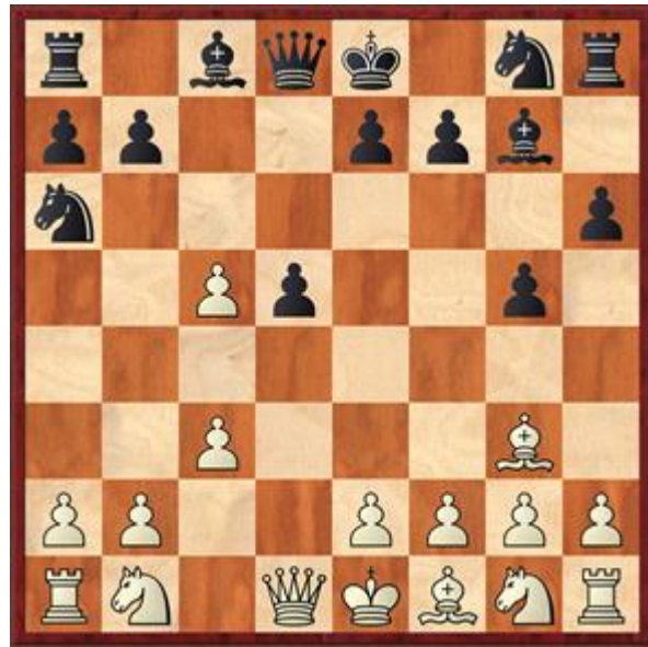
Stelling na analyse zet 6... Pa6

Tot zover herinnerde ik het mij. 3... c5 had ik ook nog in mijn geheugen, maar achter het bord sloeg de twijfel toe. Bert is de eerste en enige tegenstander die deze variant gebruikt heeft tegen mij. Dus helaas werd het 3... Pd7 3... c5 4.dxc5 g5 5.Lg3 Lg7 6.c3 Pa6 Zie diagram 2. en zwart staat een friemeltje beter in een dynamische stelling. 4.e3 Pgf6 5.c4 c6 6.Pc3 e6 7.Ld3 Le7 8.Pf3 b6 9.0-0 dxc4 10.Lxc4