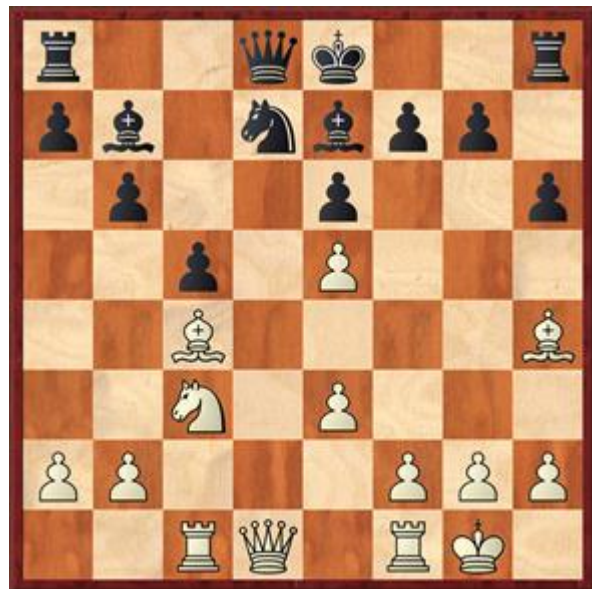
Stelling na 13... Pd7

10... Lb7 Ik stel de rokade nog wat uit, omdat ik mogelijk nog g5 ga spelen. 11.Tc1 c5? Minder, De2 nu is het aanbevolen antwoord. 12.Pe5? Nu is de stelling weer gelijk na 0-0. 12... Pxe5? Dit geeft wit een mooi steunpunt voor een paard op d6. Het paard is straks moeilijk te verjagen en wit heeft alle tijd om zijn stukken in optimale positie te brengen. 13.dxe5 Pd7 Zie diagram 4. Bert wilde hier 14.LxL DxL 15.f4 spelen maar greep mis en speelde direct 14.f4. Hij wachtte mijn antwoord niet af en gaf meteen op.