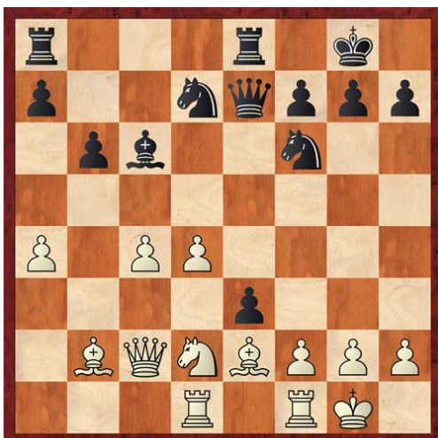
Analysediagram na 20... cxd4 21.exd4 e3

De waardering schiet al aardig omhoog (-1.32), maar met een zet die ik niet gauw iemand zie spelen (g5!). 17... d5? Een ernstige misrekening. Het minteken verdwijnt in de waardering. Wit staat nu ineens duidelijk beter. 18.cxd5 Lxd5 19.c4 Lc6 20.Pd2 Om de a-pion te dekken, maar dat had beter gekund met 20.Ta1. 20... Pf8? 21.d5 is vervelend. Beter was 20... cxd4 21.exd4 e3.