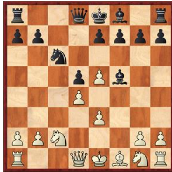
Stelling na 9... Lf5