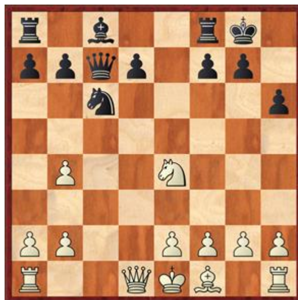
Stelling na 11... 0-0