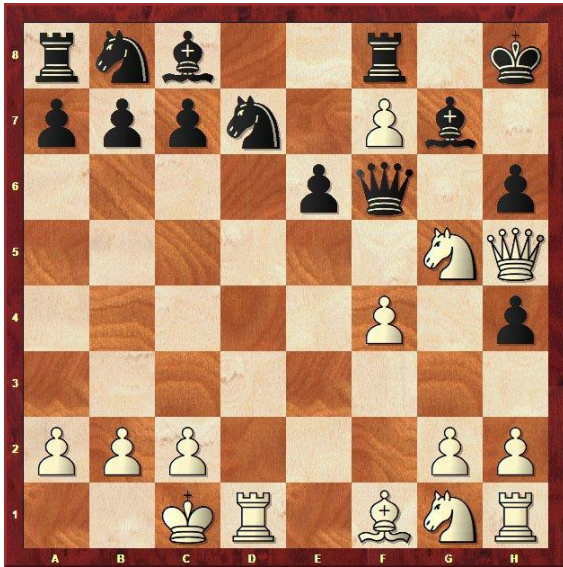
Stelling na 14... De7-f6!

Het idee is simpel; na 9.fxg5 hxg5 10.Lxg5 sla ik met de loper op e5, en dreig ik niet alleen op h2 te slaan, maar ook het hinderlijke Lg3+ omdat Th1 niet gedekt staat. Maar Hubert zat tot hier nog in zijn boek! Ik kende deze variant helemaal niet en moest alles zelf bedenken! 9.e5-e6!? g5xh4 10.Dd1-h5! 10.e6xd7+ Lc8xd7 11.Dd1-h5 e7-e6 (-1) 10... O-O 11.e6xf7+ Kg8-h8 11... Tf8xf7 12.Lf1-c4 Dd8-e8 of 12... e7-e6 13.Lc4xe6 Dd8-e7 14.Dh5xf7+ De7xf7 15.Le6xf7+ Kg8xf7) 13.Lc4xf7+ De8xf7 (-1) 12.O-O-O e7-e6 13.Pc3-e4 Dd8-e7 14.Pe4-g5 De7-f6!