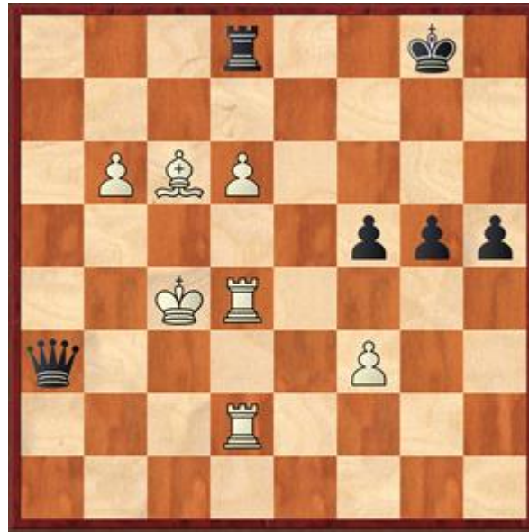
Stelling na 45.d6

Alleen 21.Td3 houdt het witte voordeel vast. 21... Tdc8 22.Dd2 De minst slechte. Tc2 23.exd4 Db3 24.Le2 Txd2 25.Txd2 Te8 26.Ld3 Td8 27.Te1 g6 28.Le4? b6 28...Txd4 29.Txd4 Dxb2+ en het is uit. 29.Lc6 Td6 30.d5 Dc4 31.Te3 a5 32.Tc3 Dh4+ 33.Ke2 Dxb2 34.bxa5 Dxb2+ 35.Kd1 Dg1+ 36.Kc2 bxa5 37.b4 axb4 38.axb4 h5 39.b5 g5 40.Tc4 f5? 40... h4 wint het snelst. 41.Tcd4 Da1 42.b6 Da2+ 43.Kc3 Da3+ 44.Kc4 Td8 45.d6? Zie diagram 4. 45... Tc8 46.Kd5? Er is inmiddels wederzijdse tijdnoed. 46.Kb5 en zwart komt moeilijk verder. 46... Dxf3+ 47.Ke5 Dxc6 48.Kxf5 Dxb6 48... Df3+ is mat in 6. 49.Kxg5 Kg7 50.Tf4 Dg3+ 51.Kf5 Te8 enzovoorts. 49.Kxg5 Tc5+ 50.Kh4 Dd8+ 51.Kh3 Dd7+ 52.Kh4 Dd8+ 53.Kh3 Kh7 54.Te2 Tc3+ 55.Kh2 Df6 56.Ted2 Df3 57.Tg2 Dh3+ 58.Kg1 De3+ En wit gaf op. 2½-5½