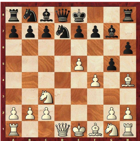
Stelling na 8... g6-g5

1.e2-e4 d7-d6 2.d2-d4 Pg8-f6 3.Pb1-c3 g7-g6 4.Lc1-g5 Lf8-g7 5.e4-e5 Pf6-d7 6.f2-f4 h7-h6 7.Lg5-h4 d6xe5 Meteen 7... g6-g5 kon ook. 8.Lh4-g3 g5xf4 9.Lg3xf4 d6xe5 10.d4xe5 Pd7xe5 8.d4xe5 g6-g5