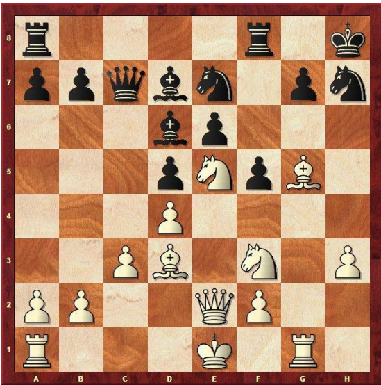
Stelling na 17.Ld2xg5?!

Ik wilde graag Ph4 spelen en daarom sloeg ik met de loper (om na 17...Pxc5 18.Txc5 te spelen), maar 17.Pxc5 Ph7xg5 18.Pe5xd7 Dc7xd7 19.Tg1xc5 was circa 0,8 sterker. Weliswaar zijn er nu ook twee stukken geruild, maar dat zijn wel twee verdedigers, en zwarts koningstelling ligt wel open. En ik heb de g-lijn, waar na 0-0-0 (of Kd2) de andere toren ook naartoe gaat.