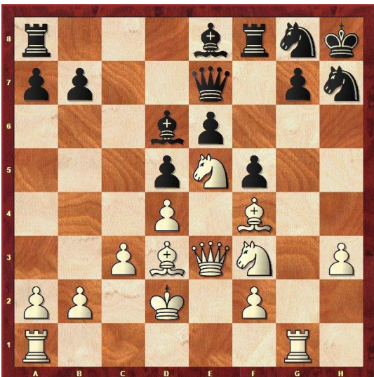
Stelling na 19.Lg5-f4

17...Ld7-e8 18.De2-e3 (ik wil niet dat Jos via Lh5 mijn aanvalstuk Pf3 afruilt) Pe7-g8?! [Beter was 18...Pe7-g6 19.Pe5xc6+ (19.0-0-0 Ta8-c8) 19...Le8xc6 20.Pf3-e5 20...Ld6xe5 21.De3xe5 (21.d4xe5 f5-f4) 21...Dc7xe5+ 22.d4xe5 Ph7xc5 23.Tg1xc5; met +1,3 tegen +2,2 nu] 19.Lg5-f4