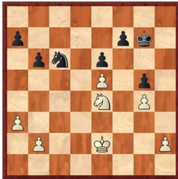
Stelling na 30... hxg5

23... Txc4 23...Td1+ 24.Txd1 Txc4 24.Txc4 Kg7 Gespeeld om straks Td4 te kunnen spelen, wat nu niet kan vanwege Pf6+. Een andere optie was 24...Td1+ 25.Ke2 Tb1. 25.g4 Td4 26.Txd4 Pxd4 27.f4 Pc6 28.a3 h6 29.Ke2 g5 30.fxg5 hxg5 Zie diagram 4. De stelling is volkomen gelijk. Mijn tegenstander had nog 5 minuten, dacht 3,5 minuut na en kwam met een verliezende zet. 31.Kd3?? 31.Pxg5 Pxe5 32.h3 Pc4 33.Pe4 en de waardering is 0.00. 31... Pxe5+ 32.Kd4 Pf3+ 33.Ke3