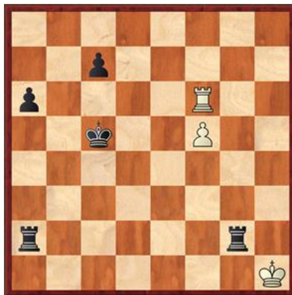
Stelling na 50.Kh1