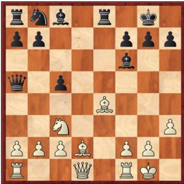
Stelling na 14... 0-0

De Pirc. 7.h3? er valt niets te pennen voor zwart, dus dit is tempooverlies. 7.0-0 Pxe4 8.Pxe4 d5 9.Ld3 dxe4 10.Lxe4 Met voordeel voor wit. 7... Pxe4 8.Pxe4 d5 9.Ld3? 9... 0-0 moest. 9... dxe4 10.Lxe4 Zie diagram 2. 10... c5? Zwart wint minimaal een pion na 10... Te8 11.Pe2 Lb4+ 12.c3 Dxd1+ 13.Kxd1 Txe4 14.cxb4 Txb4 11.Pb5 Da5+? 11... Dxd1+ 12.Kxd1 Pc6 en het is helemaal gelijk. 12.Pc3 Lf6 13.Ld2 Te8 14.0-0