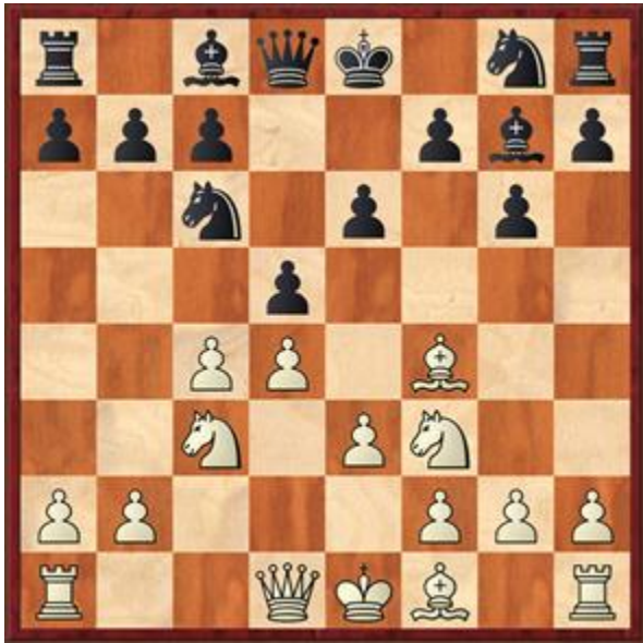
Stelling na 6.Pc3