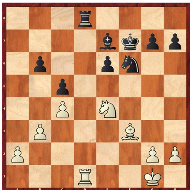
Stelling na 29... Td8

9.dxc5? Zwart mag gratis een pion dichterbij het centrum brengen. 9... bxc5 10.Lb5 Pb8 Tempoverlies. 11.Pe5 Ld7 12.Pxd7 Pfxd7 Opnieuw tempoverlies. 13.Dg4 13... Pf6 14.Dh3 Db6 15.Ld3 Zie diagram 2. 15.La4 Dxb2 15... Pbd7 15... Dxb2 16.e4 c4 17.Le2 Pxe4 en wit kan opgeven. 16.b3 e5 17.Lg3 e4 18.Le2 De6 19.Dxe6 fxe6 20.f3 exf3 21.Lxf3 Tad8 22.Tad1 Pb6 23.Lc7 23... c4 23... Td7 24.Lxb6 axb6 25.c4 d4 26.exd4 Txd4 27.Tfe1 Kf7 28.Pe4 Txd1 29.Txd1 Td8?