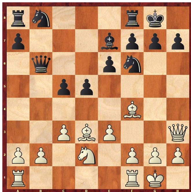
Stelling na 15.Ld3

9.dxc5? Zwart mag gratis een pion dichterbij het centrum brengen. 9... bxc5 10.Lb5 Pb8 Tempoverlies. 11.Pe5 Ld7 12.Pxd7 Pfxd7 Opnieuw tempoverlies. 13.Dg4 13... Pf6 14.Dh3 Db6 15.Ld3 Zie diagram 2. 15.La4 Dxb2 15... Pbd7 15... Dxb2 16.e4 c4 17.Le2 Pxe4 en wit kan opgeven. 16.b3 e5 17.Lg3 e4 18.Le2 De6 19.Dxe6 fxe6 20.f3 exf3 21.Lxf3 Tad8 22.Tad1 Pb6 23.Lc7 23... c4 23... Td7 24.Lxb6 axb6 25.c4 d4 26.exd4 Txd4 27.Tfe1 Kf7 28.Pe4 Txd1 29.Txd1 Td8?