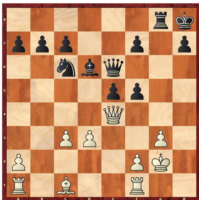
Stelling na 27... f5

18... Txg4 18... Dg5 19.hxg4 Dxc4 20.Dh6 Df5 21.Dh4 Tg8 22.De4 Dh3 23.Dg2 Dg4 24.De4 Dh3 25.Dg2 Df5 26.De4 Hier bood Jan remise aan, maar Cor zag nog kansen. 26... De6 27.Kg2 f5 Zie diagram 4. 28.Dh4? 28... Dc4 28... f4 Nog beter is 28... Dd5+ 29.Kh2 Tg6 29.Th1 Dd5+ 30.Kg1 Dxd3 31.Lb2 fxc3 32.Df6+ Tg7 33.f3 Het is mat in 7. 33... Dc2 en Jan gaf op.