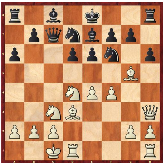
Stelling na 11.Dh3

1.e4 c5 2.Pf3 d6 3.d4 cxd4 4.Pxd4 Pf6 5.Pc3 a6 Siciliaans, de Najdorf.] 6.Lg5 e6 7.f4 Le7 8.Df3 Dc7 9.0-0-0 Pbd7 10.Ld3 h6 10... b5 wordt hier ook vaak gespeeld. 11.Dh3