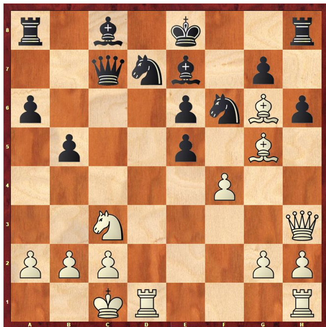
Stelling na 14.Lg6+

11... b5? 12.Pxe6! Dit heeft hij vast al eens eerder op het bord gehad. 12... fxe6 13.e5 dxe5 Ook 13... b4 helpt niet meer. 14.Lg6+ Kd8 15.Lxf6 Pxf6 16.exf6 Lxf6 17.Pe4 d5 18.Kb1 Tf8 19.f5 14.Lg6+ Zie diagram 2. 14... Kd8 14... Kf8? 15.Dxe6 Dc4 16.Pd5 is mat in 2. 15.Lxf6 15.The1 15... Lxf6 15... gxf6 16.Dxe6 Tb8 16.Dxe6 Tb8 17.Pd5 Dc5 18.Pxf6 De7