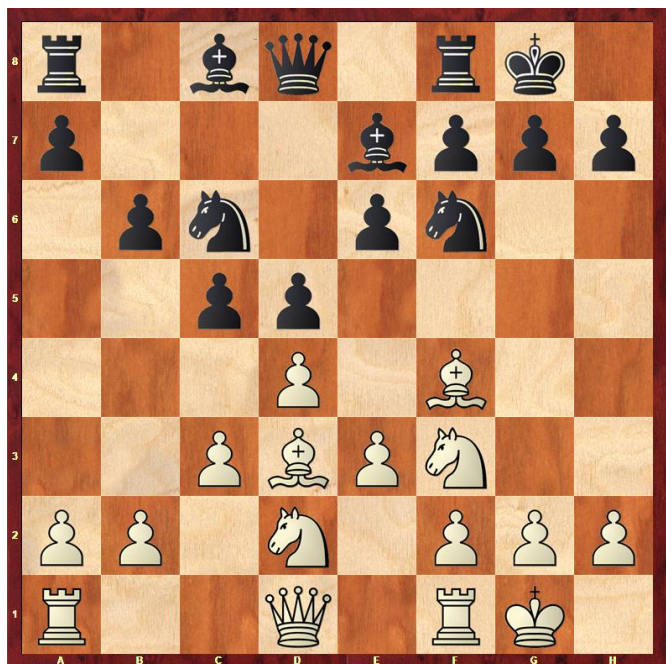
Stelling na 8... b6

1.d4 d5 2.Lf4 e6 3.Pf3 Pf6 4.e3 c5 5.c3 Pc6 6.Pbd2 Le7 7.Ld3 0-0 8.0-0 b6