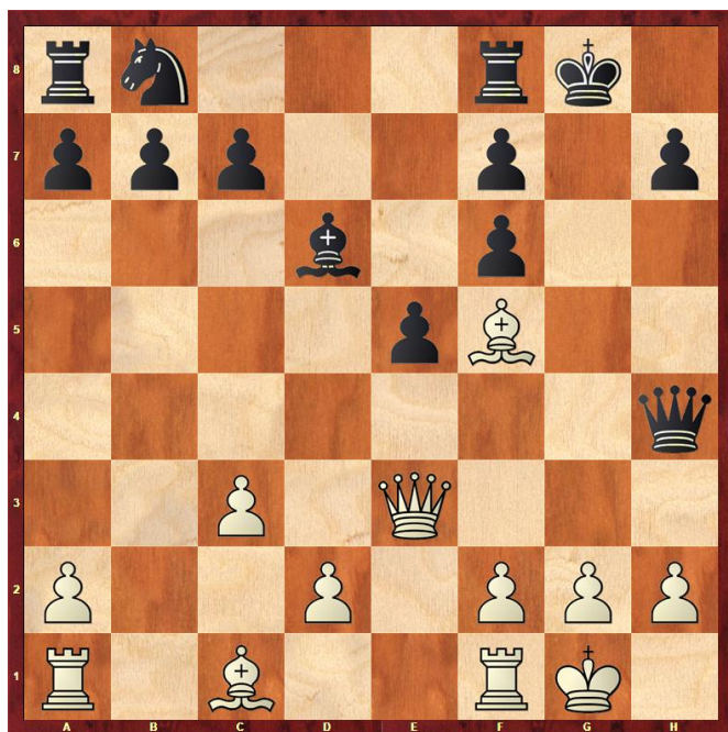
Stelling na 14... Dh4

9... Dxc2 Riskant. 10.0-0 10.f4 Da4 11.De2 Pc6 12.fxe5 Le7 (12... Lxe5?? 13.Lb5) 13.d4 10... 0-0 11.Pe4 Lf5? 12.Ld3 Da4 13.Pf6+ gxf6 14.Lxf5 Dh4 Zie diagram 2. 15.h3 15.De2 Kh8 16.d3 Tg8 17.g3 Da4 (17... Pc6 18.Kh1) 18.Lxh7! 15... Pc6 16.d3 16.Df3 e4 17.Lxe4 16... Kh8 17.g3 17.Df3 e4 18.Lxe4 17... Tg8 18.Lg4 18.De2 Pe7 19.Lg4